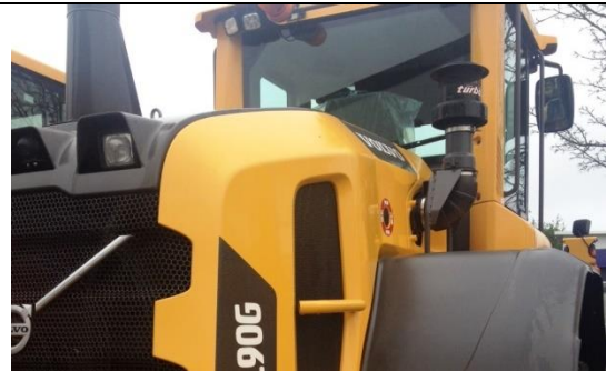
Volvo L90G 2 700 tim 2014