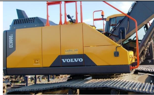
Volvo EC300Ei 2017