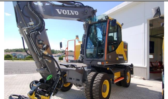
Volvo EWR150E 2017