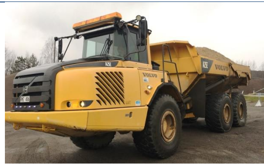
Volvo A25E 9 700 tim 2007