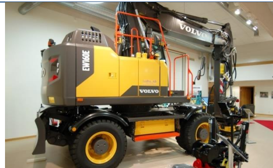
Volvo EW160E 2017