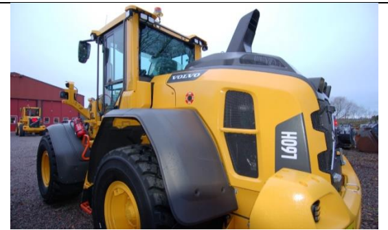
Volvo L60H 650 tim 2016